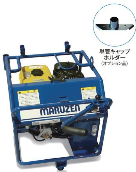
単管キャップホルダー (オプション品)